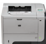
Stampante HP LaserJet Enterprise P3015dn