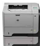
Stampante HP LaserJet Enterprise P3015x